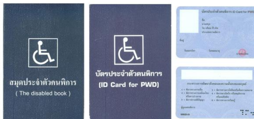
ตัวอย่างบัตรและสมุดประจำตัวคนพิการ

กรณีได้รับเบี้ยยังชีพคนพิการอยู่แล้วและได้ย้ายเข้ามาในพื้นที่เทศบาลตำบลสร้างก่อ จะต้องมาขึ้นทะเบียนและยื่นคำขอรับเงินเบี้ยยังชีพความพิการที่เทศบาลตำบลสร้างก่อ และให้ได้รับเบี้ยความพิการจากองค์กรปกครองส่วนท้องถิ่นในเดือนถัดไป ทั้งนี้ต้องได้รับการยืนยันจากองค์กรปกครองส่วนท้องถิ่นเดิมที่จ่ายเงินเบี้ยความพิการเพื่อไม่ให้เกิดความซ้ำซ้อน